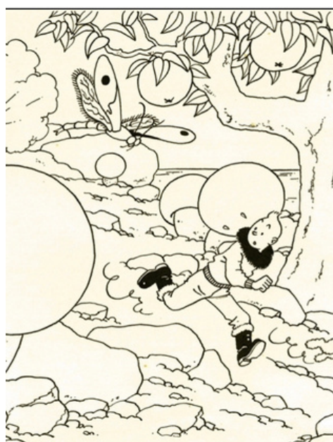
La galerie Phillippe Heim Puzzle Etoile Mystérieuse