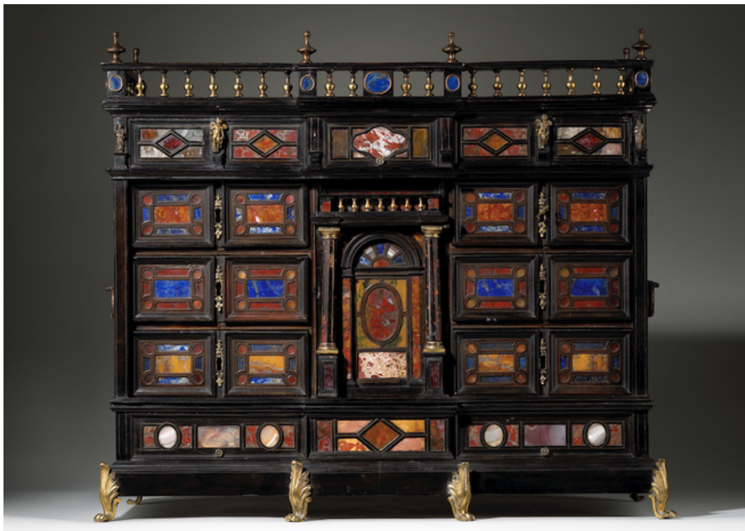
Galerie Desmet- Cabinet en Pierre dure (Rome, 17ème siècle).

La BAS regroupe de nombreux styles d'œuvres présentés par les galeries participantes : Egypte Antique, Grèce Antique, Mobilier du 18ème, Art Tribal, Symbolisme, Art Déco, Art Nouveau, Verre de Murano, Sculptures du 19ème, Art Japonais, Art Chinois, Tableaux des primitifs flamand, Art Contemporain, Bijoux anciens, Bijoux contemporains et bien d'autres encore.