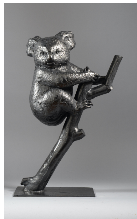
Univers du bronze by JIVKO

Selon la tradition, l'ouverture aura lieu jeudi soir. A cette occasion, une réception VIP sera organisée à la fois par l'organisation et dans les galeries individuelles.