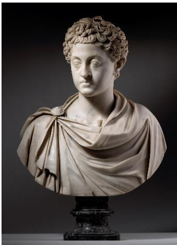
Bartolomeo Cavaceppi (1716-1799) (attribué à) Le jeune empereur Commode Marbre blanc, marbre de Saint Anne Rome, fin du XVIIIe siècle H 72 x L 54 x P 25 cm

Ce buste extrêmement raffiné représente Commode, un empereur romain qui a régné de 177 à 192. Il a servi conjointement avec son père Marc Aurèle de 177 à la mort de ce dernier en 180, puis a régné seul jusqu'à son assassinat. Son règne est généralement considéré comme marquant la fin d'une période dorée de paix dans l'histoire de l'Empire romain, connue sous le nom de Pax Romana.